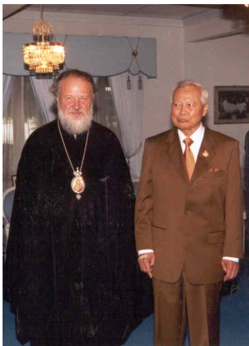
на фото: Высокопреосвященнейший Митрополит Кирилл и Президент Тайного Совета короля Таиланда генерал Прием Тинсуланок

На следующий день Высокопреосвященнейший митрополит Кирилл встретился с Президентом Тайного Совета Короля Таиланда генералом Приемом Тинсуланок.