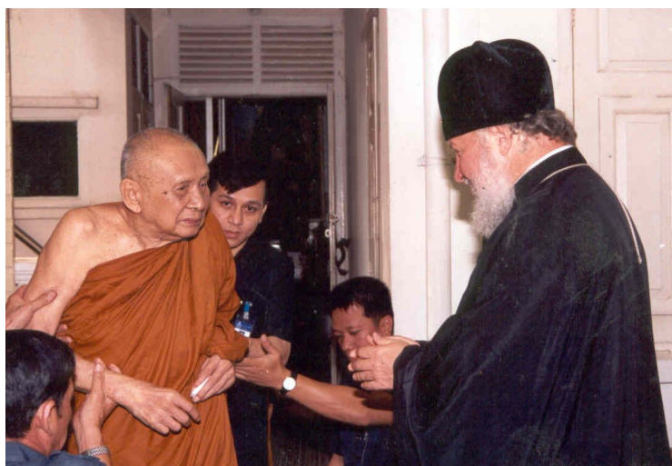
на фото :Высокопреосвященный Митрополит Кирилл и Верховный патриарх буддистов Таиланда Сомдет Пхра Ньясамвара.

В тот же день в сопровождении Чрезвычайного и Полномочного Посла России в Таиланде Е.Д.Островенко и настоятеля Свято-Николаевского прихода игумена Олега (Черепанина) Владыка Кирилл нанес визит вежливости Его Святейшеству Верховному Патриарху буддистов Таиланда Сомдету Пхра Ньясамвара (Суваддхана Махатхера).